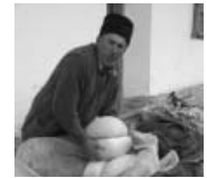
修道院にチーズを届ける