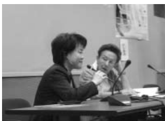
韓国代表による次回開催国立候補

10月6日は、会議の最終日であり、10時から事務局会議が行われた。ド・ラ・トゥール会長から、大会のまとめを行い、ユネスコに提出したいという意向が出され、下記のような意見交換が行われた。