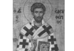
聖人ニコラス(フレスコ画)