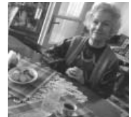
クルテア・デ・アルジュのステレス婦人とクッキー