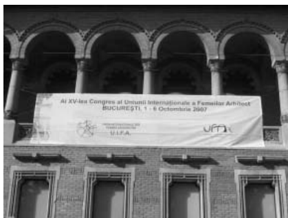
農民博物館に掲げられた第15回世界大会の横断幕

2007年10月1日から6日迄の6日間の会議は、首都ブカレストで開催された。登録後、コンgresバッグを配布され、会議はド・ラ・トゥール会長の大会宣言に始まった。会場は歴史あるイオン・ミンク建築大学構内と農民博物館内。世界の会員参加者は約125名、参加国25ほどだ。日本の参加者は同伴者を含め総勢24名。日本語