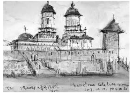
ヤシ市街を一望出来る丘にある要塞型のチェタツィア修道院 (スケッチ：柳澤佐和子)