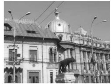
ローマ広場(ロムルスとレムス)の小パリの景観

4日目はデンマーク、ルーマニア、USA、ブルガリア、フランス、アルゼンチンの発表があった。建築やまちの歴史的価値の発見と再構築の実践例、元共産圏からは個の存在を拒否され家族の絆の重要性を確認し住宅で具現化した例、また粗略にされた歴史的建築物保存の重要性、女性の社会的地位未確立国からはその役割の歴史的的分析確認が自らの方向性の確信をもたらすとの報告があった。午後からはブカレスト市内見学とフェアウェルパーティー。市内は元小パリと呼ばれただけあって緑深き公園や歴史的な建築物や教会も多く残っていた。高層建築物は見なかった。私個人は公衆トイレから公的サービスが住民本位レベルに至っていない事を推測した。それはトイレの数不足、不十分な清掃管理、ユニバーサルデザインの未整備に見えた。夜のパーティーは、ルーマニアの民族舞踊や音楽の披露があり、また他国の方と身振り手振りで交流を楽しんだ。今回、私の見たUIFA世界大会での最大の収穫は、女性建築家の立場を切り開いてきた諸先輩の現在も健在である、しなやかでたくましい人間性とバイタリティーであり、私も大きな「元気」を得た。