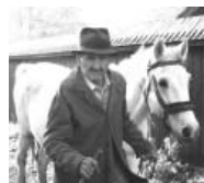
プトナの朝