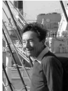
船上のド・ラ・トゥール会長