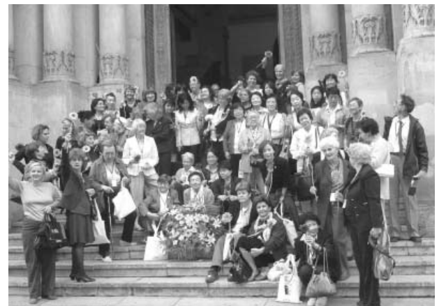
閉会式後イオン・ミンク大学前で記念撮影

この国を読み解くところみに対し、背骨となるカルパチア山脈と気候風土・農耕牧畜文化、ダキアから始まり様々な民族が行き交い、1989年共産圏から抜け今年1月にEUに参加したこの国の歴史は難解だ。その歴史をどのように評価し未来につなげるか、会議やポストコンgresツアーを通じ、この国のIdentityを模索する様子が、大会運営スタッフのエネルギーとホスピタリティの中に深く感じた会議だった。次回は隣国韓国と決定。UIFA JAPON会員の多数参加は、各々の人生にとって必ずやプラスとなるに違いない。