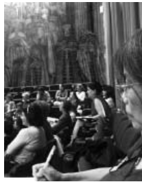
壁画のある階段教室でのセッション