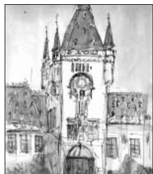
ヤシの文化宮殿(旧モルドバ公国皇太子邸)(スケッチ:柳澤佐和子)

ルーマニア正教では週の二日は乳製品のはいた食事とらないという。ニャムツ修道院の2日目の朝食は、なすのペースト(サラダ・ド・ヴィネテ)も、ポテトフライもマーガリンなのだそう。長テーブルを囲んだ修道院の食事が心に残る。荷馬車が車と共に当たり前に行き来する土地柄、素材がおいしい。トマト、パプリカ、ペンションの大きなピッチャー入りのヨーグルト、目玉焼きのおいしさには脱帽。プロヴィナのペンションでの白いチーズとポレンタ(ママリガ)と目玉焼きをぐちゃぐちゃにして食した前菜も目新しく、おいしかった。ルーマニアのみそ汁・チョルバといわれる酸味系田舎スープがおいしい。トランシルヴァニアの古都シビウ近くで食した肉団子入りチョルバは、連日の不規則な食事の長旅と氷雨に疲れた私たちの胃にはことさらに優しいスープだった。帰国後、みつけたレシピで早速試してみる。小麦粉を発酵させた酸味系調味料ボルシュの代わりに、リンゴ酢とレモンで試みたがルーマニアの味にはなりきれない。やはりボルシュか。リンゴとレーズンなどをサンドしたケーキがおいしい。リンゴはリンゴ酢としても多く使われているようで、酸味系味付けがマイルドだ。最終日クルテア・デ・アルジュで散歩中ひよんなことから何うこととなったお宅で供された、作りたてのプラムジャム入りクッキーは、旅の最後のデザートだった。