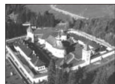
プトナの要塞教会