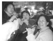
市場で買った木彫の笛を手に