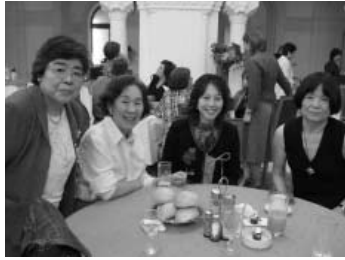
ウェルカムパーティー

夕方6時にホテルに集合、バスでウェルカムパーティーの会場となる「国民の館」に向かう。久方ぶりの再会に感動の言葉と熱い握手が交わされ、華やかな場面が繰り広げられている。