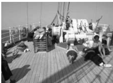
黒海船上で日差しを楽しむ

5日は会議はなく、早朝から3時間をかけバス3台に分乗し黒海沿いの都市コンスタンツァに向かう。