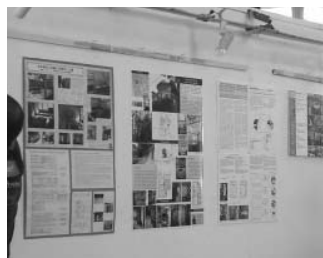
パネル展示

オープニングセッションは会場となった大学の学生による「アカデミエイ通りからのエントランス」の「アイデンティティ」をテーマにした作品の発表等があり、作品はパネル展示のコーナーを華やかに飾っていました。