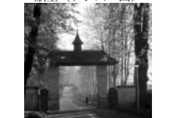
プトナ修道院の「鳥居」