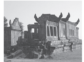
タイ国境のプレア・ビヘアの遺跡

「物も人もその一瞬一瞬をどめおくことは出来ない。その造られた時から既に崩壊の過程を辿って行くのである。」この厳然とした哲理の前に、先生は保存とは「時間と自然との微妙なバランスの中に安定を与える作業だ」と表現された。