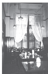
カフェには昭和初期の雰囲気漂う