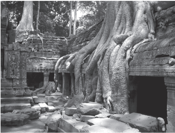
巨木の絡むタプロム遺跡

先生は東大を1968年卒業後、東大助教授、教授と進まれ、英国留学、ハーバード大学客員教授など、世界的に御研究を深められ、その御業績で、建築学会賞(論文)、芸術選奨文部大臣新人賞、サントリー学芸賞等と学問・文芸と幅広く、一般人にわかりやすい文体で濃い内容を表現される方です。この先生をお迎えして、「世紀の発見」とされたアジアの遺跡保存のお話を総会の記念講演として伺いました。