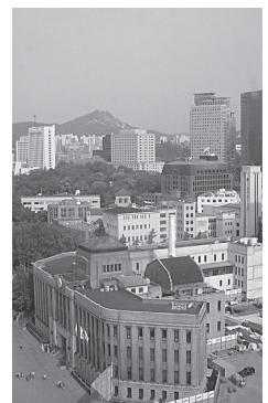
ソウル市の山並みを残した景観(市庁舎近くのホテルから)

18世紀末に遷都計画があったソウル郊外の世界遺産、水原市の華城も、城壁などよく観光資源として修復されており、ソウル市内の歴史遺産も公共事業的予算配分がされているという印象を受けた。日本の旧総督府庁舎を解体して修復した景福宮では、光化門はまだ工事中だったが、内部では王朝時代の衣装をつけた衛兵交代式が行われ、産業としての観光促進に政策的意思が感じられた。