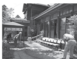
ようこそ新へんなかフェへ

6月20日、改修により危険度が軽減したためお披露目会を、翌日にお茶会を開き、住民の皆様にくつろいでいただきました。この建物の元の所有者は被災後長岡ニュータウンに引っ越しており、解体の話聞き、昨年、譲り受けて拠点として整備しています。建物は幕末～明治期の築、中越