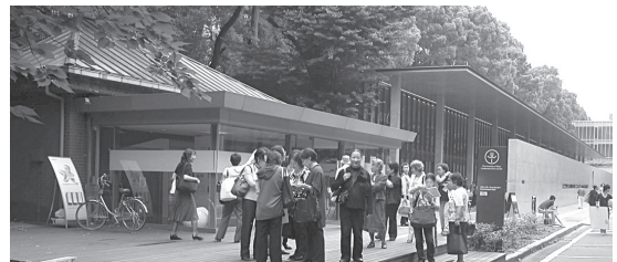
人力車車庫をリノベーションしたインフォメーションセンターと建物高さを抑え、緑の中に沈められた地下2層の福武ホール

東京大学本郷キャンパスは、南北に伸びる本郷通りに沿って、間口約1.2km、奥行き約300mから700m、旧加賀藩の江戸屋敷跡を含む、約17万坪の広大な土地だ。80棟を超える建物群をつなぐ、縦横に樹木が植えられた道を1時間余り、参加者20人程で自由散策した。大正時代に建てられた化学東館から最新の福武ホールまで、大正から昭和、平成と100年あまりの時代を駆け抜けた気分だ。元気な声とともに活動の様子が建物から緑へ溢れ出てきて大学らしい雰囲気、梅雨の中休み・穏やかな曇りであった。外観を踏襲した建物群から外壁保存し内部をリノベーションした建物から新しい分子を投入した新築建物まで、さまざま。三四郎池のように変わらずキャンパスを見つめてきたものも。統一感から個性へ、アイデンティティの確認へと、時代の流れを感じる。また大学のための大学から、開かれた大学へと変革しつつある。それぞれの時代に未来図はつくられ、今後も何段階かにわけて未来図が創られていくのであろう。