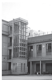
建物との調和に配慮した新設エレベーター