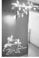
写真は下から1階～4階、入り口壁面の彩色は男子は群青色、女子は葡萄色。白い幹と白色系カッティングシート11色で葉を表現。デザイン：楊英美