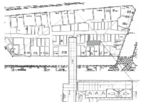
図3 新宿西口思い出横丁と改修後のトイレ(2007) 男女入口の方向を分けた。通路の壁は黒いアルミスバンドレルで、黒板のイメージ。落着き防止にもなっている。(トイレ図面提供 小林純子、レイアウト 井出幸子)