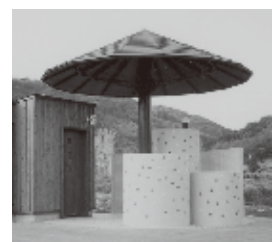
写真1:長崎県諫早市森山町 通学路トイレ (2002)

設計/一樹設計企画(担当:小林純子) 「母子トイレ」「父子トイレ」や身障者トイレを備えている。今では「多目的トイレ」等として珍しくなくなったところに、このトイレの先見の明がある。男子小便器の風車型配置など今見ても斬新。(図面提供 小林純子、キャプション 石川和代)