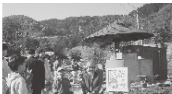
写真2: 森山町 子供たちとアートワーク 子どもたちに親しんで大切に使うよう、工事中にアートワークと一緒に。一寸誇らしげで楽しそうな笑顔の子供たちと大人たちが、このトイレの「育ての親」。 (キャプション 石川和代)

徹底した観察、インタビュー調査、利用者の統計、さらに利用者の参加などでニーズを把握してデザインする方法を評価して下さいますが、そのような方法は、住宅を設計するときと同じです。生活する立場で考えるという姿勢や方法は、トイレに出会う前から、住居学科卒業以来、あるいは在学中から蓄積さ