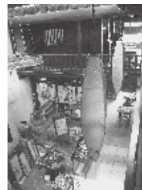
中庭から前家を見る

ホイアンと合わせてハノイの集合住宅の紹介もあった。現代的な集合住宅であっても部屋と部屋の境にドアがなく鉄格子など風を通すもので仕切る。室内の間仕切り壁に窓を付け通風を確保しているものもある。とにかくプライバシーよりも通風が重用視される。区切られたスペースを確保するという住文化ではないのだ。エドワード・ホールの本のなかでイギリス人は幼少期、兄弟は同じ部屋に住み、一人になりたいときはしゃべらない等一人になりたいというサインを出すことで、周囲も了解し、多人数のいる空間でも一人になることができるとあった。ベトナムにも住まい方の作法があるのだろう。