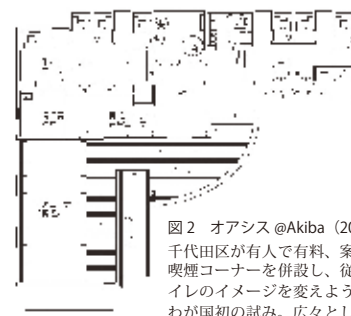
図2 オアシス@Akiba (2006) 千代田区が有人で有料、案内所や喫煙コーナーを併設し、従来のトイレのイメージを変えようとしたのが国初の試み。広々とした個室や通路で女性でも入りやすく「また使おう」と思わせる設計は流石。SUICAで支払えるのも便利。 (図面提供 小林純子、キャプション 石川和代)