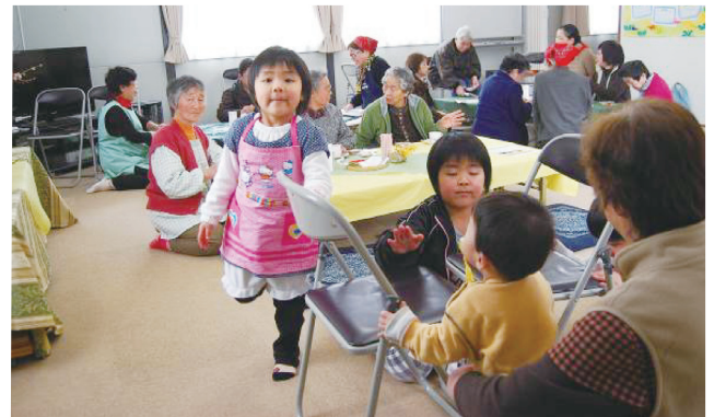
第3回「どこでもカフェ」子供たちもお手伝い

今後も継続を望む声は強く、また他の地域からも開催を求める声が上がっています。今後は地元協力者と仮設内外の住民の協力で開催できるシステムを構築し、専門分野の経験を活かした支援に力を注げるよう考えて行きたいです。活動母体として12月に「おもてなしチーム」を立ち上げましたので、興味のある方は是非ご参加ください。