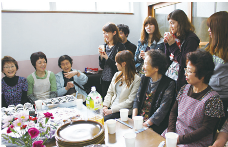
気仙沼でお母さん達と学生との昼食会

学生とのボランティア活動では、被災の状況を主体的に経験し、人々と交流して他者の痛みを感じる力や、自分の役割を実感するよう促す事ができました。会員の皆さんによる被災した方々の生活改善や心のケアに関する活動には、生活や地域環境を専門的に扱う女性ならではの視点があったと思います。家庭人として多くの役割を果たしながら専門家として社会に貢献してきたからこそ、総合的な柔らかい視点です。現在、それが大きな行政レベルや専門家としての仕事に反映されないことの歯がゆさと問いはますます強くなっています。その問いに対して、本特集ではいくつかの真摯な意見が寄せられました。