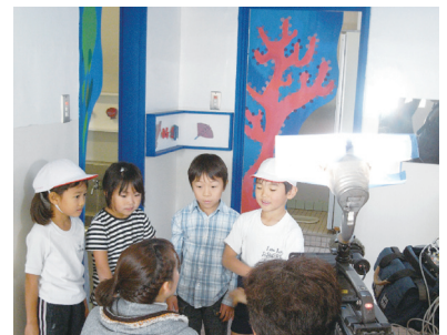
NHK「いっと6けん」の取材を受ける青葉台小学校の製作者達

子どもたち、生徒たちが作ったものなので大切にしてください。心のこもったそこにしかないものが出来上がるので、新聞テレビが取材にきて、注目されるのが子どもたちの誇りに繋がります。