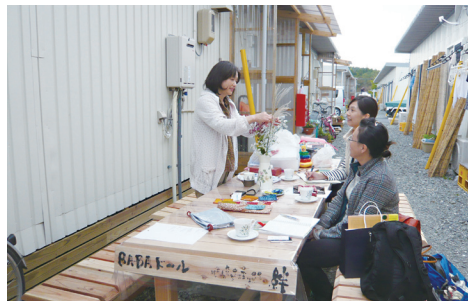
平行配置の仮設住宅の路地 CAFE (南三陸町)