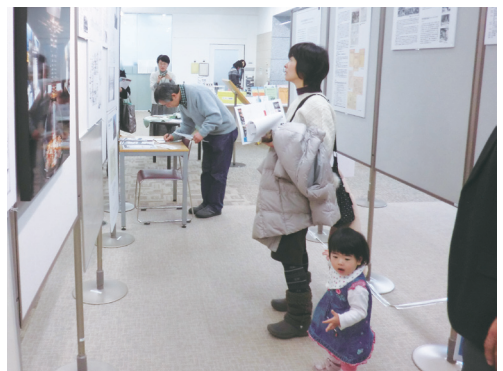
親子連れも多い横浜会場

神奈川方向の建築関係の方たちにPRをしました。また建築の専門家以外の方も熱心にご覧いただきました。女性の建築家のパイオニアの人たちがその時代に建築の仕事で働くということの大変さやエネルギーに思いをはせて下さったようです。