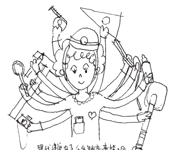
現代建築女子4年制卒業生の日 (作: 黒石)