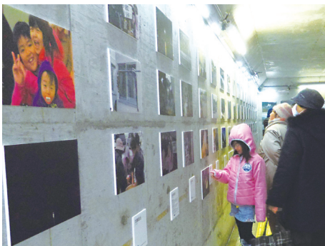
多くの方々の関心を呼んだ写真展(写真：在塚)

そして、支援活動は、多くの会員の関与、カフェや写真展への参加や支援物資の提供などを通して広がっています。取り組みは、会長の陣頭指揮のもと、理事