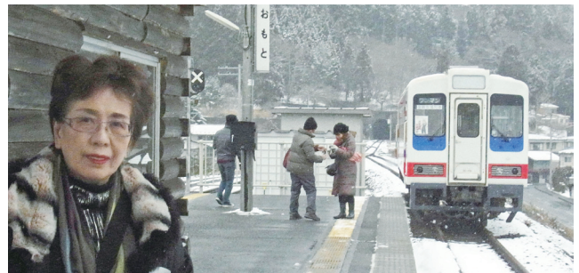
小本駅の三陸鉄道北リアス線開通直前の試験列車

この1年、建築士会、ゾンタクラブ、全国法人会として様々な支援活動に参画しているが、私個人としては、千年に一度という災害、自分の目で確かめ、見て感じて知って欲しい、そんな想いで数々の被災地ツアーを引き受け、被災者との橋渡しをしている。来るべき日のため被災者は、日々の生活の糧になるものの援助品で暮らし、兎に角貯蓄しなければならない。永い永いご支援を皆さん待ってます。助けて上げて下さい。こんな1年目、被災地はまだです。