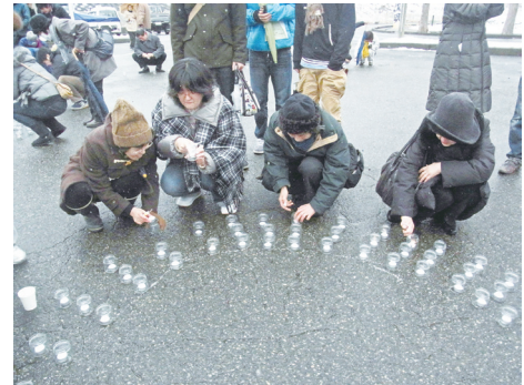
小本駅前広場で慰霊の灯に点火

第55回海外交流会「持続可能な社会におけるデザイナーの役割」報告 ボランティア活動とASWA組