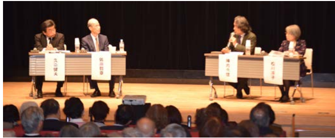
UIFA JAPON 2018 海外交流会の会

設立以来、2~3年ごとに世界各地で国際大会を開催、その大会のテーマに沿った発表・展示・視察を行ってきました。UIFA JAPON