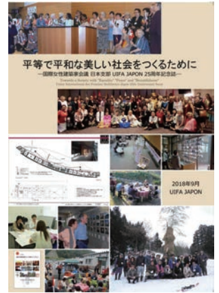
UIFA JAPON 25周年記念誌