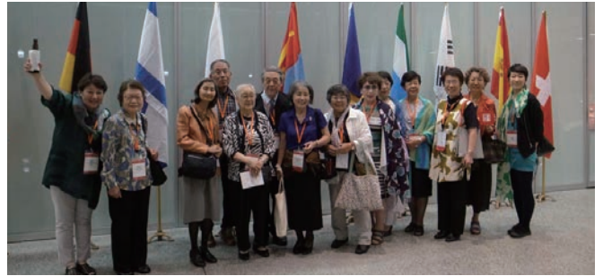
ブラックスバーグ (アメリカ)2015大会

UIFA国際大会は女性による国際交流の場として、また、専門的情報交換や問題提起の機会となっています。