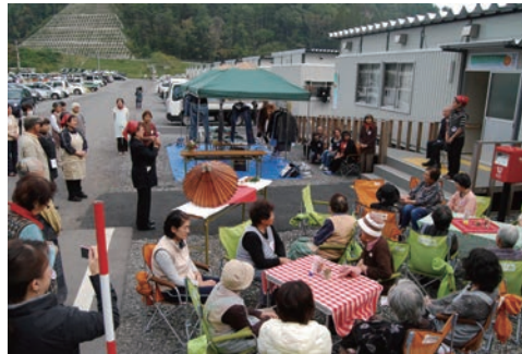
東日本大震災「どこでもカフェ」活動