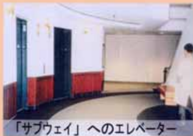
「サブウェイ」へのエレベーター