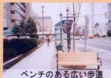
ベンチのある広い歩道

ロチェスター市（米ミネソタ州）はメイヨクリニック・病院を核に世界中から集まる患者や医者を対象にしたホテルなどが多い特殊な街である。