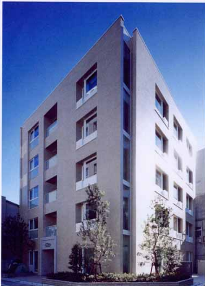
AFLAC ペアレンツハウス AFLAC PARENTS HOUSE

AFLAC ペアレンツハウスは、小児ガン等難病の子供と家族のための総合的な支援施設です。「自然」をテーマに外観は「ふた葉」のイメージでデザインされ、希望にあふれ、これからも成長していく姿を表しています。内装は日常生活の中で明るく楽しい気持ちを持続できるよう、「ふれあい」と「あたたかさ」のある空間を目指しました。家庭的な落ち着いた雰囲気を得られるよう暖かい質感を持った木を多用しています。