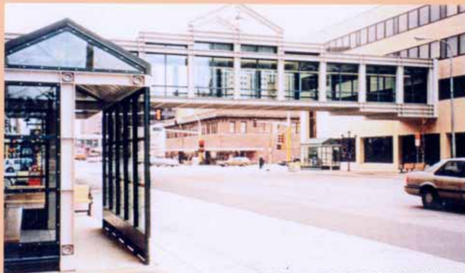
スカイウエイや日除けのある歩道