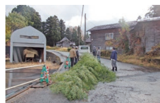
11月、正月のさいの神の準備。藁を集め、竹を切る。今年の竹は立派だ。(宮本伸子)