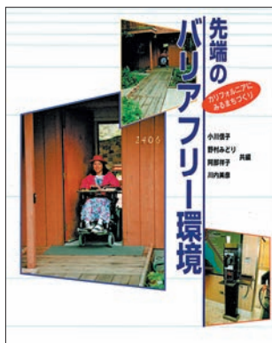
中央法規出版株式会社 1996 年 7 月 10 日発行