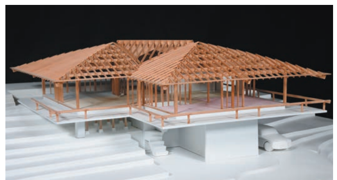
毛呂山の家の木構造フレーム模型