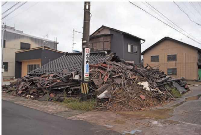
七尾市田鶴浜では、まだ倒壊した建物が放置されている状態があるのが衝撃だった