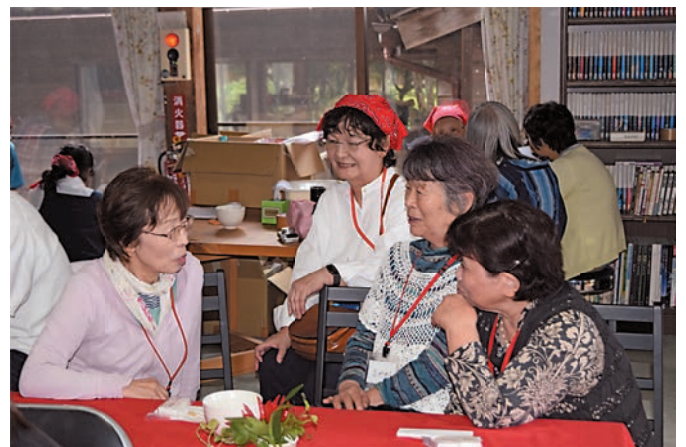
七尾・徳源寺での寺カフェ+どこでもカフェでは「久しぶりネ」の会話と孫世代の学生との会話が花が咲いた