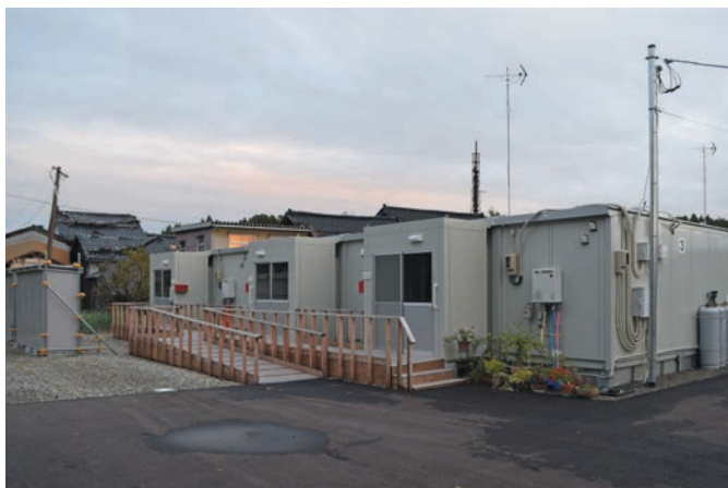
田鶴浜町第一団地のコンテナ型仮設住宅