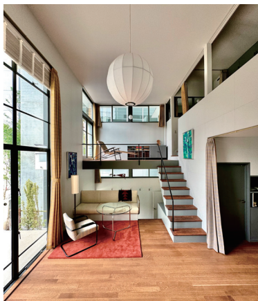
2024年土浦邸内部は当初の色彩で復原