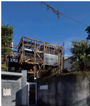
2022年11月17日全景 解体が始まり、居間大型開口上部のトラスが現れる