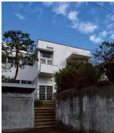
2020年5月15日全景 品川区上大崎

安田幸一氏主な作品：ポーラ美術館、東京造形大学 CS PLAZA、大分マリンパレス水族館うみたまご・あそびいち、東京工業大学附属図書館、福田美術館、ポーラ青山ビル等 著書：ニューヨーク・モダンリビング（丸善）、建築設計資料水族館（建築資料社）、林昌二の仕事（新建築社）、土浦亀城邸（鹿島出版会）等