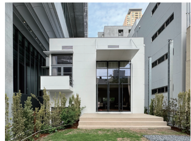
2024年全景 ポーラ青山ビル隣に移築