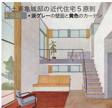
1935年新建築誌より 当初の室内図が掲載されていた